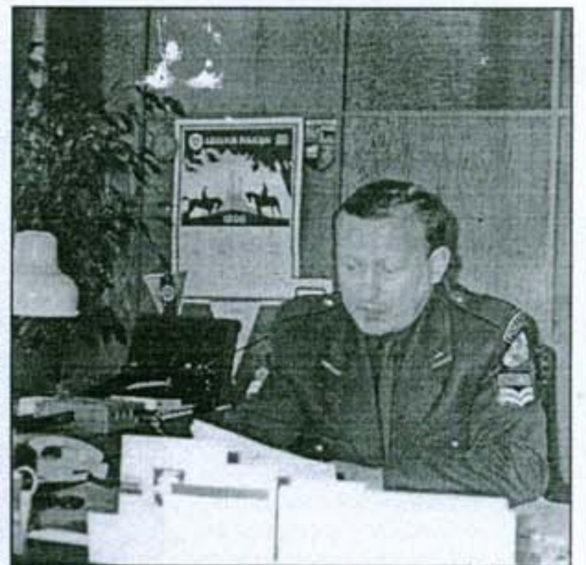
Komisaras tradiciškai pažėrė daugybę skaičių.

Viešose vietose padaryti 36 nusikaltimai, gatvėse - 12. Nepilnamečiai nuskalt 43 kartus, teisti asmenys - 109, neblaivūs - 82. Registruotos net 399 vagystės - 84 daugiau nei per tą patį laikotarpį pernai. Beje, vagystės, kaip visada, "populiariausias" nusikaltimas.