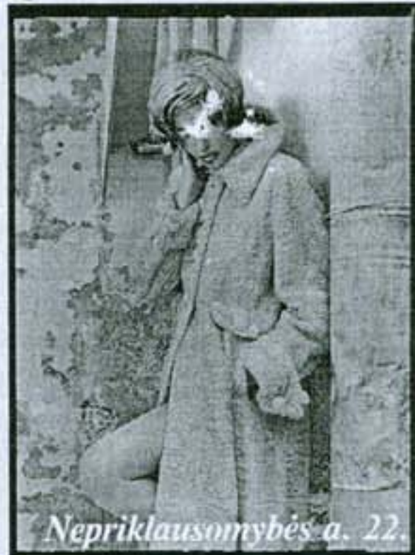
Nepriklausomybės a. 22.