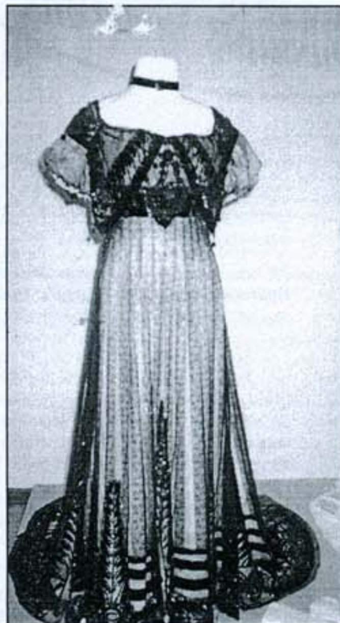
Puošni vakarinė suknelė sužavės ne vieną moterį.

Puošni vakarinė ispaniško stiliaus suknelė sužavės ne vieną šiuolaikinę moterį. Ji skirta vakarui, įvairiems priėmimams. Apie 1902 metus ją siuvo Paryžiuje. Suknelė išsiuvinėta karoliukais, labai gili dekolte. Beje, suknelė turi 2 pasijonius. Vienas iš jų pasiūtas iš siugždančios me-