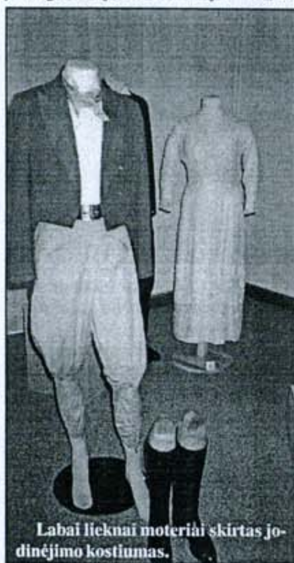
Labai lieknai moteriai skirtas jodinėjimo kostiumas.