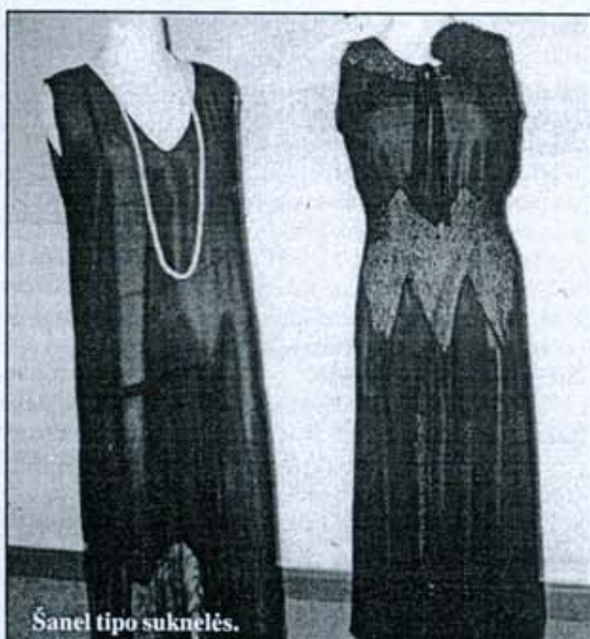
Šanel tipo suknelės.