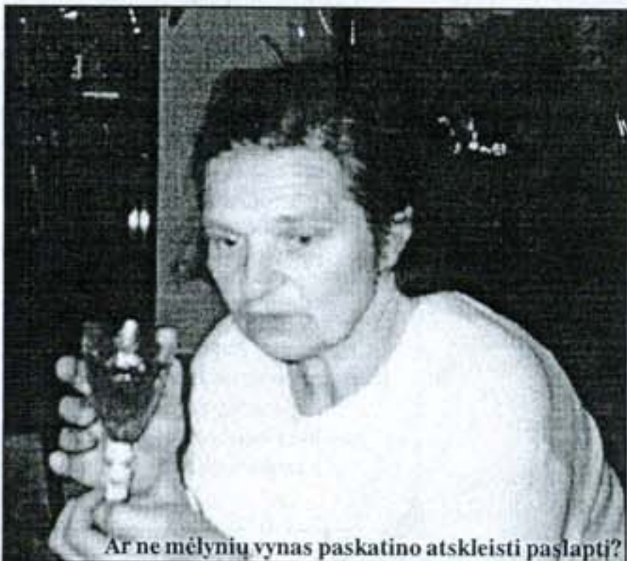
Ar ne mėlynių vynas paskatino atskleisti paslaptį?