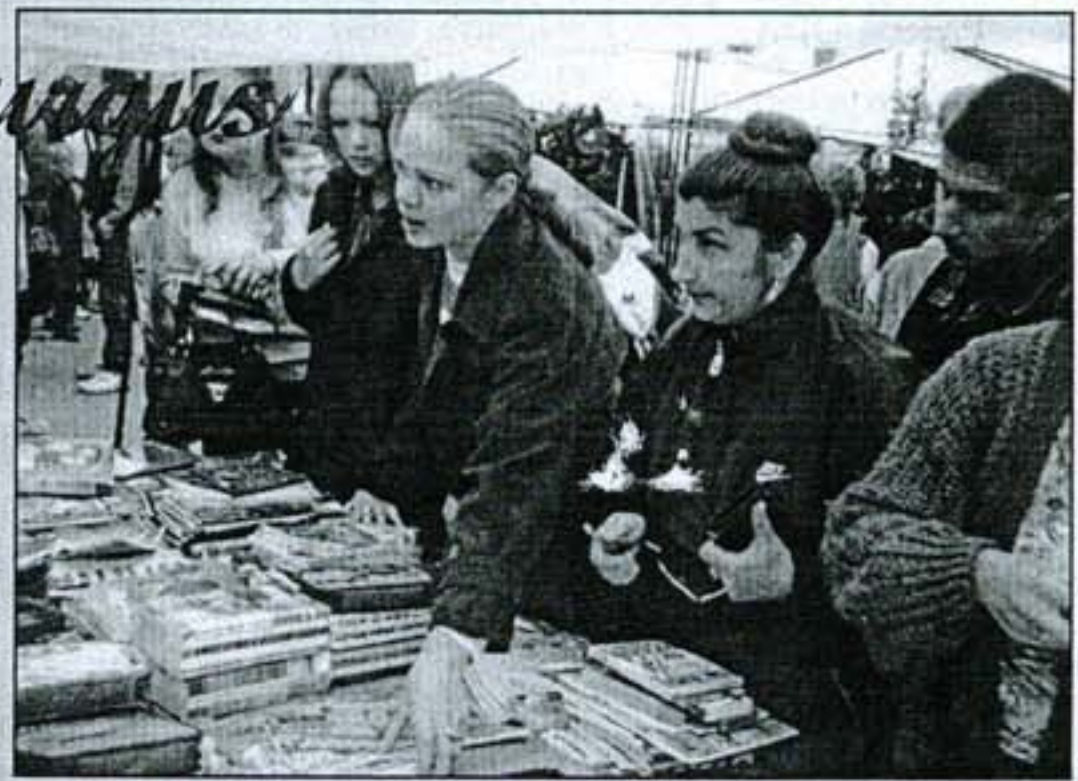
Mokyklinės prekės ant prekystalių neužsiguli – rugsėjis.

O mes juk tapome dvasingeni, galvoju. Bent jau taip tvirtina laikraščiai ir politikai. Deja, jei tik dviratis neprirakintas, tuoj