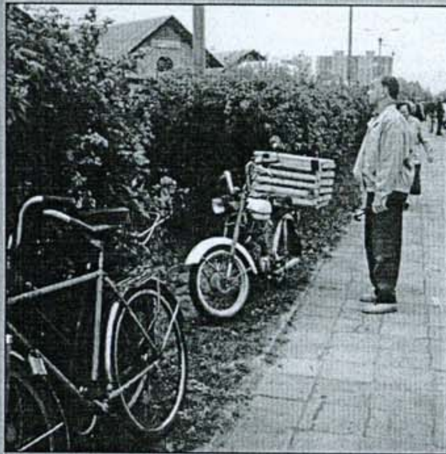
Kiekvienas dviratininkas nori išvengti šou.

Šeštadienio turgus. Pasižvalgykime, kas jame gero ir įdomaus.