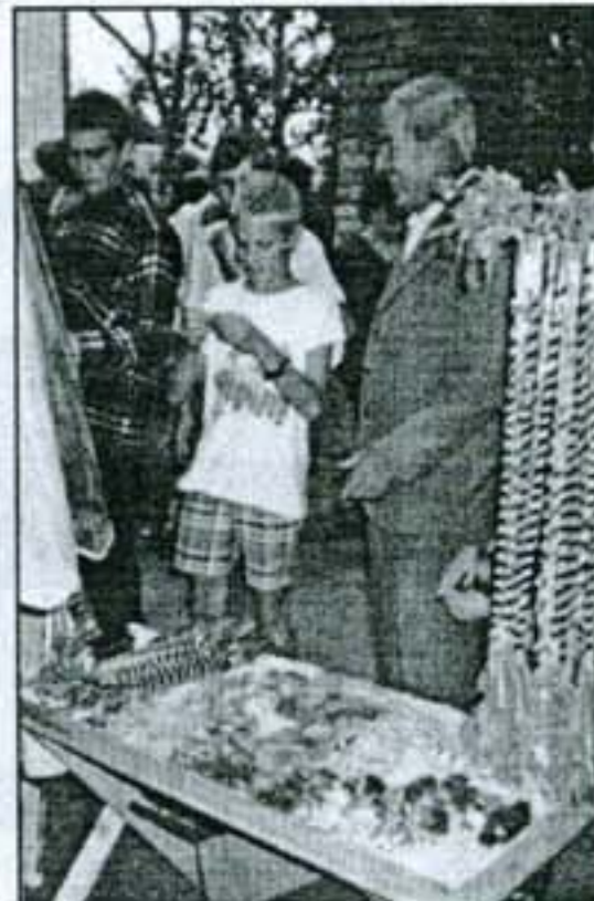
Pusmetrinės saldinių girliandos vilioja ir jauną, ir seną.

Visko nepamatsi, visko neaprašysi, kad ir kaip norėtum. Saldainiais apsikaisę pandėliečiai pasakojo, kad tą dieną pašventinta Pandėlio vė-