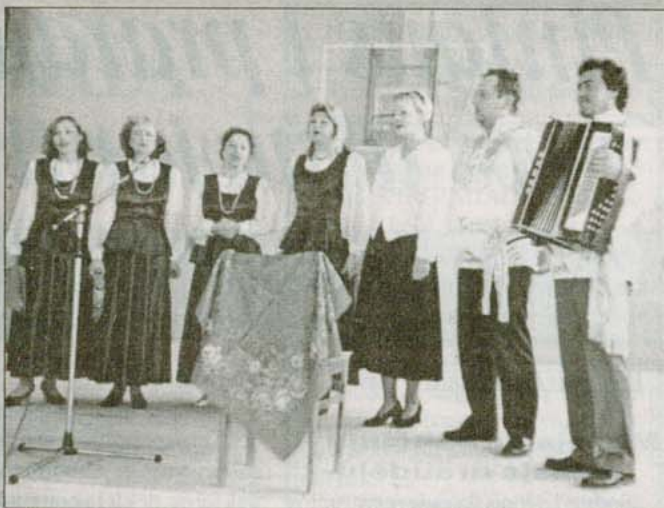
"Ivuška" koncerto metu.

- Daina padeda suburti žmones, sėja gėrį,