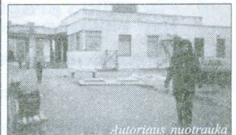
Pavasarį autobusų stotis zebro kailį pakeis į naują.