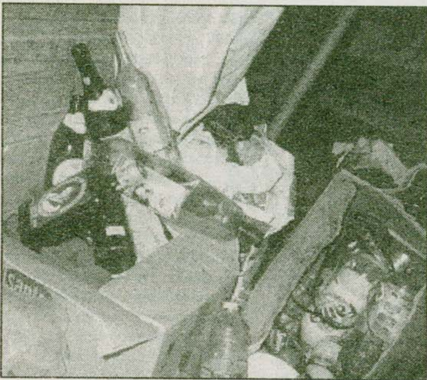
Anupro atmintyje užsifiksavo tik šis vaizdas iš jau minėtos virtuvės.