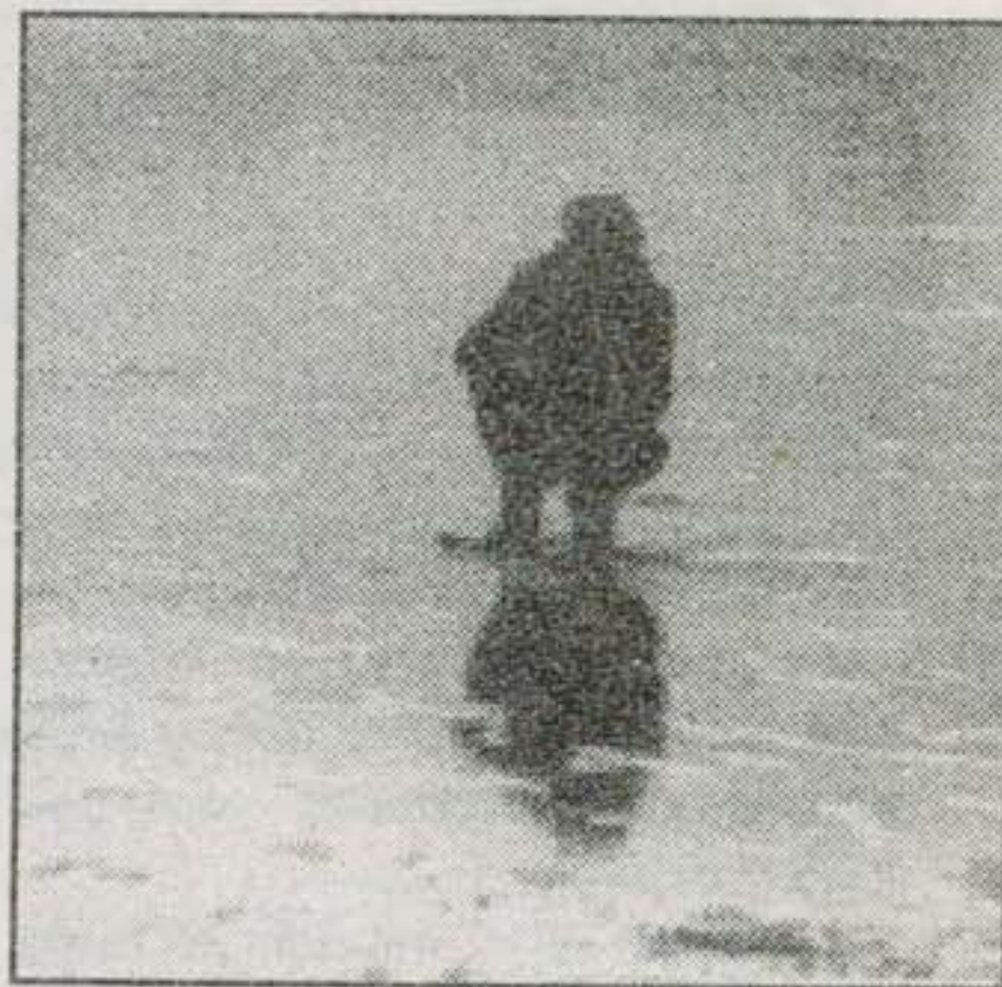
Žmonės, eidami ant ledo, turi įsitikinti, ar jis stiprus.

"Rokiškio pragiedrulių" prenumerata 1999 metams