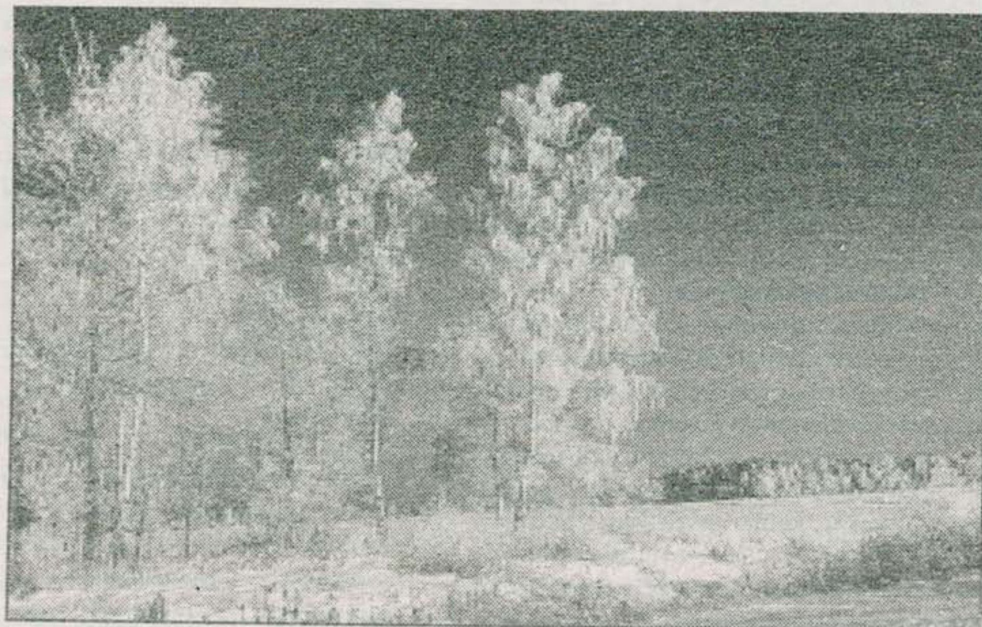
Apšerkėniję mūsų žiemos ...