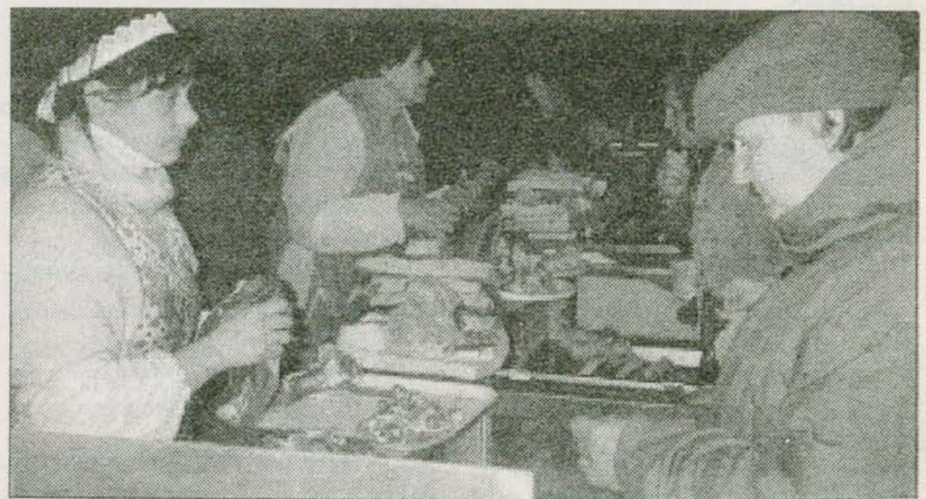
Svarbiausia įsitikinti, ar mėsytė tikrai gera.

Vienintelis dalykas, ką gali patarti ins-