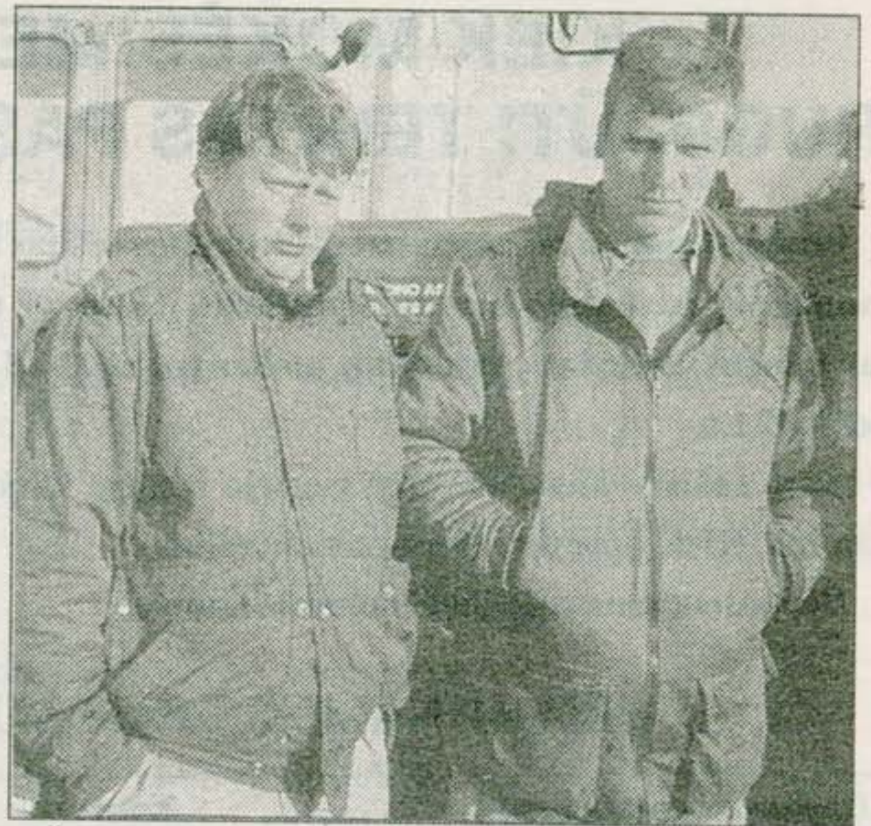
Šiems ūkininkams prie "Obelių aliejaus" teko pastovėti daugiau kaip pusantros paros.