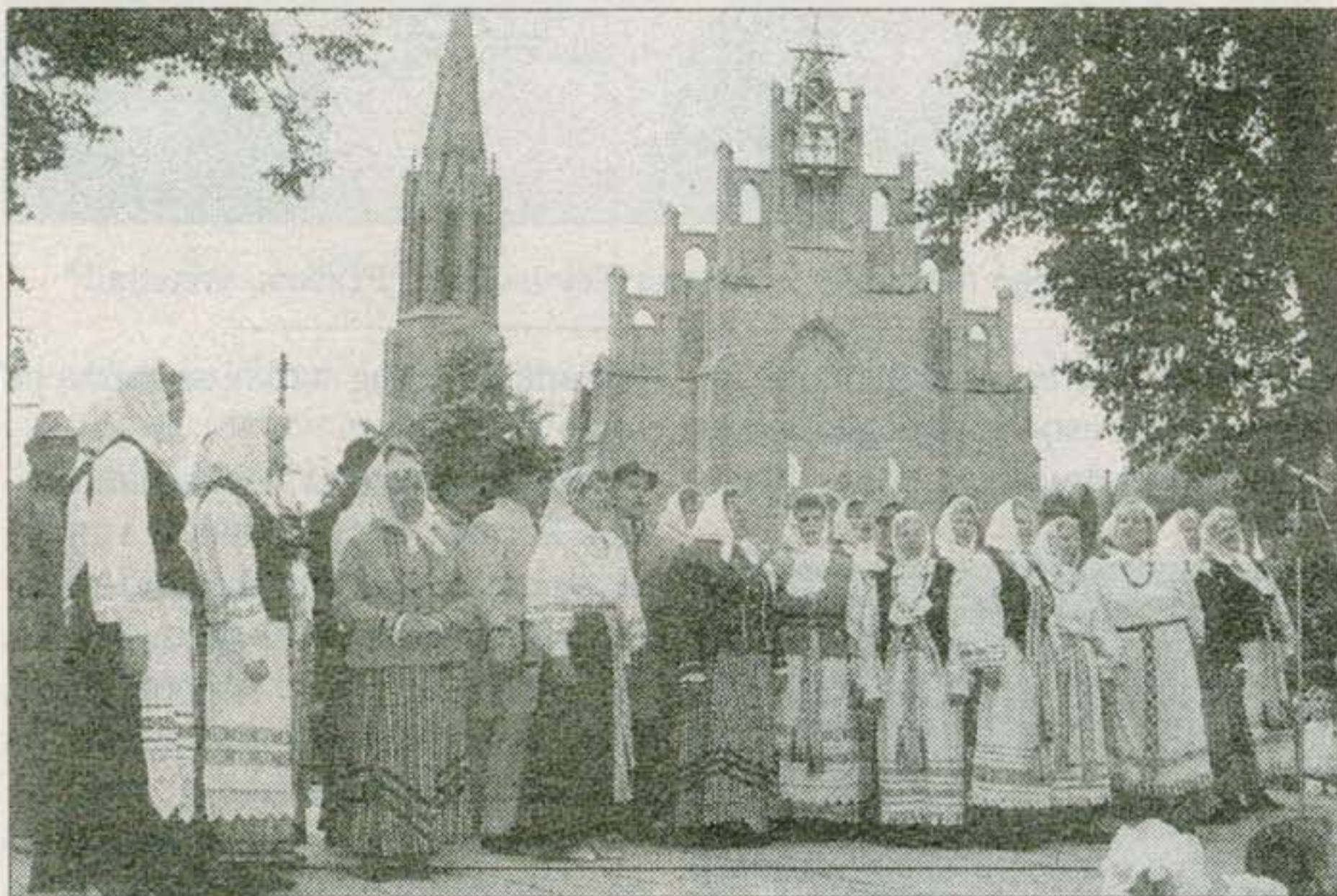
Etnografinis ansamblis "Saulala".

Folkloro ansamblis "Gastauta" (vad. N.Lungienė, G.Viduolis) rugsėjo mėnesį buvo koncertinėje išvykoje