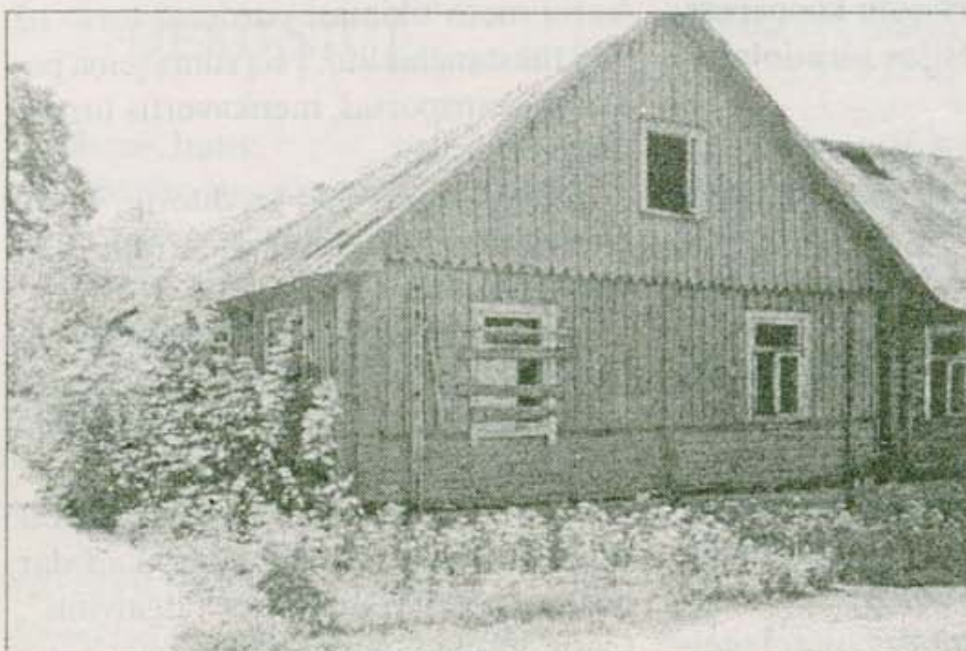
Vytauto gatvės "nendrelė".