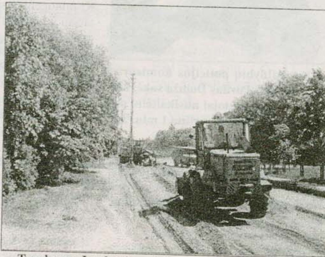
Tvarkoma Juodupės gatvė.

Vygandas Pranskūnas Autoriaus nuotraukos