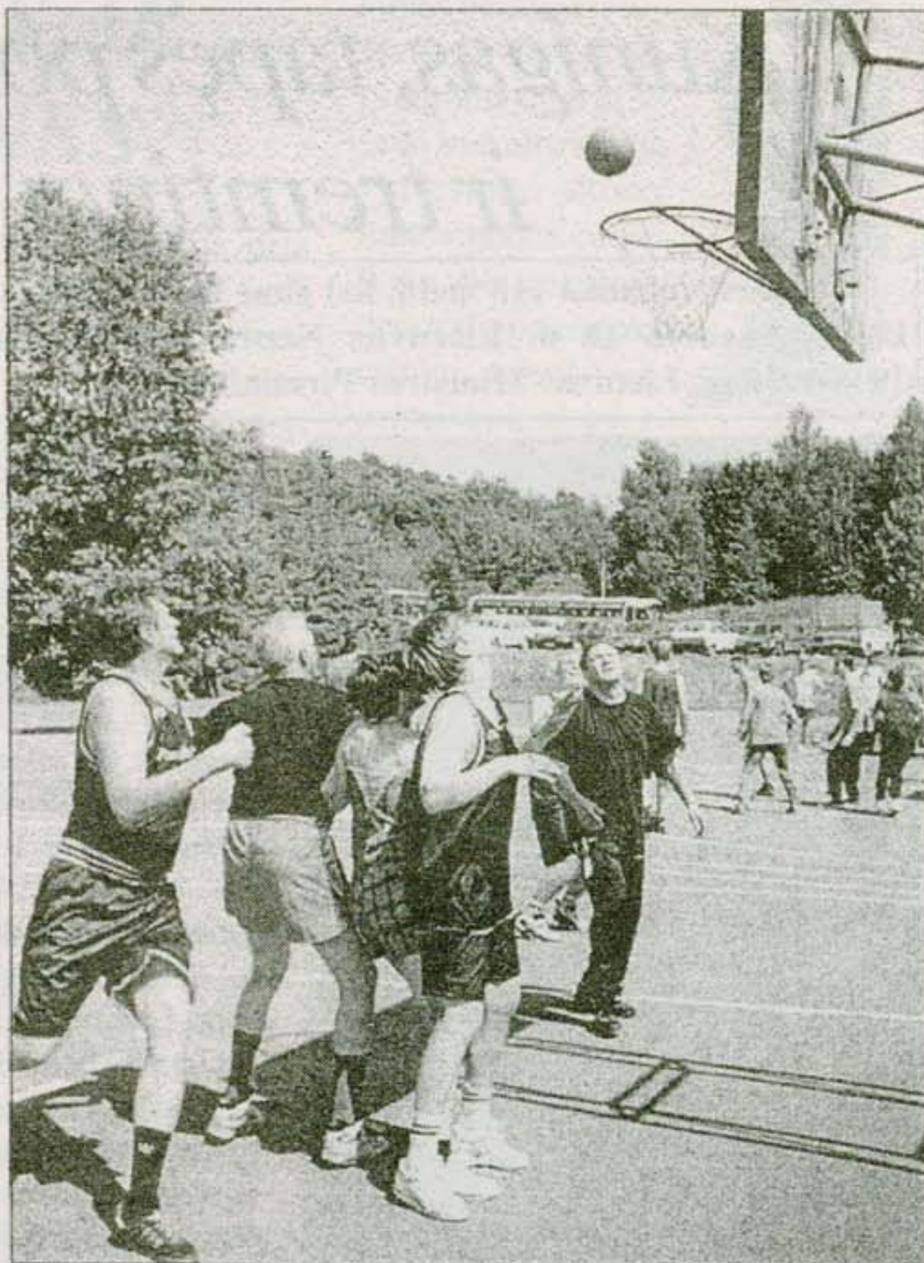
Mūsų krepšininkai uteniškius vis dėlto "nokautavo".

Vakare prie laužo skambėjo dzūkiška daina, suvalkietiški pokštai, žemaitišką išmintį keitė aukštaitiška. Vyko meninės saviveiklos konkursas. Po to - šokiai iki pirmųjų gaidžių.