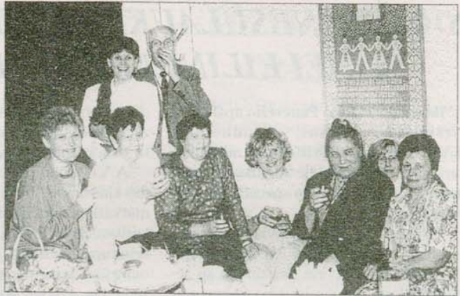
Po iškilmingų kalbų bibliotekininkai ir jų svečiai, žinoma, susėdo ir prie stalo.

Didžiausia dabartinė problema, anot Z.Jodeikienės, kaip ir visose biudžetinėse įstaigose – lėšos. Viešajai bibliotekai